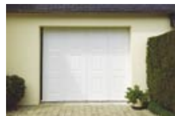
1 - ouverture et fermeture totale

La motorisation assure une conformité à la norme NFP 25 362, limitant à 30 kg la pression à l'écrasement.