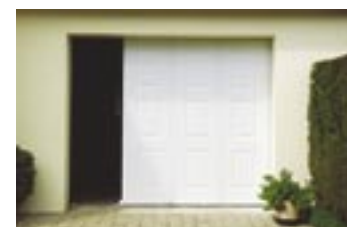
2 - Fonction portillon (réglable)